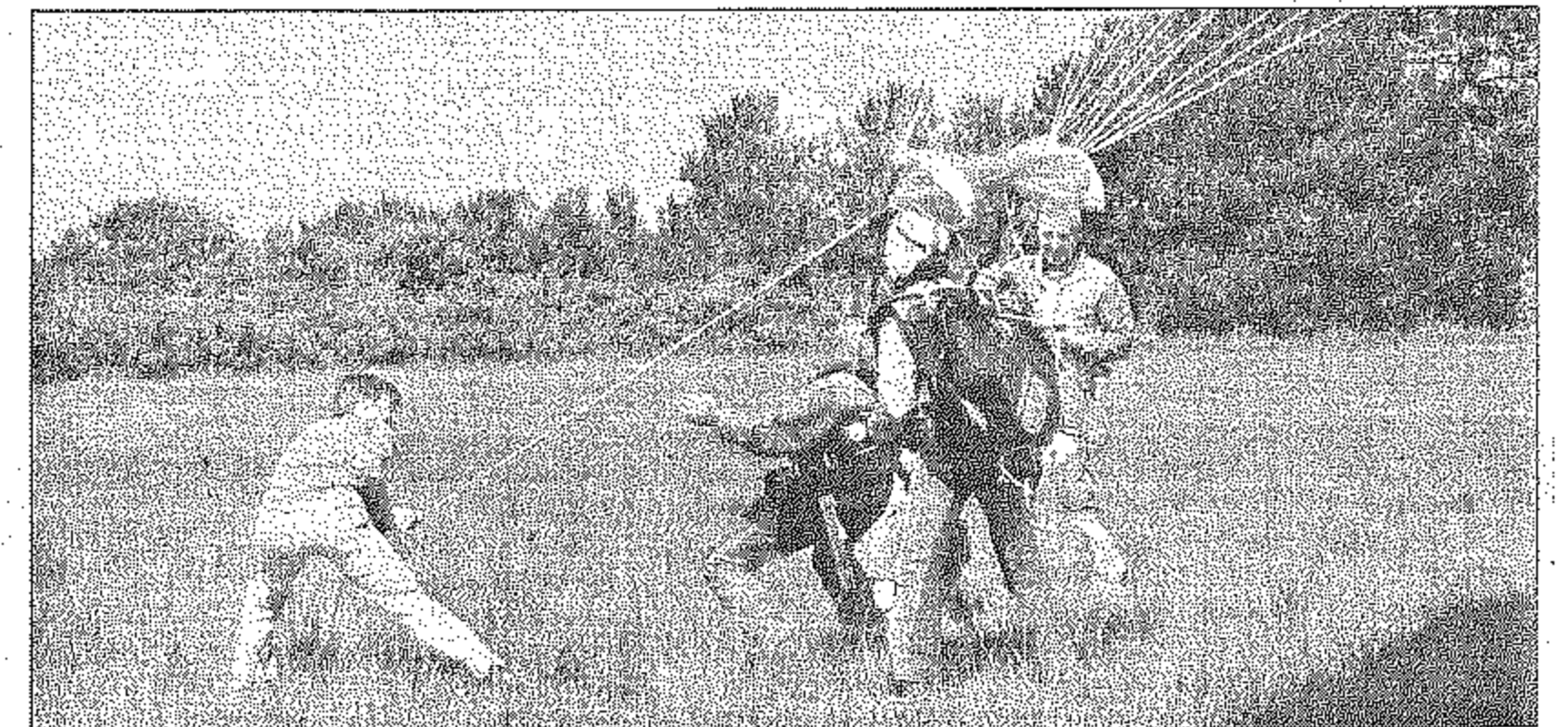
Attention à l'arrivée ! On se pose avec... douceur.