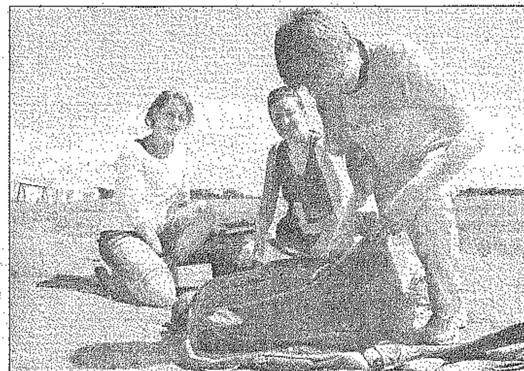
L'opération de pliage au sol : délicate, précise, minutieuse, technique et vitale !